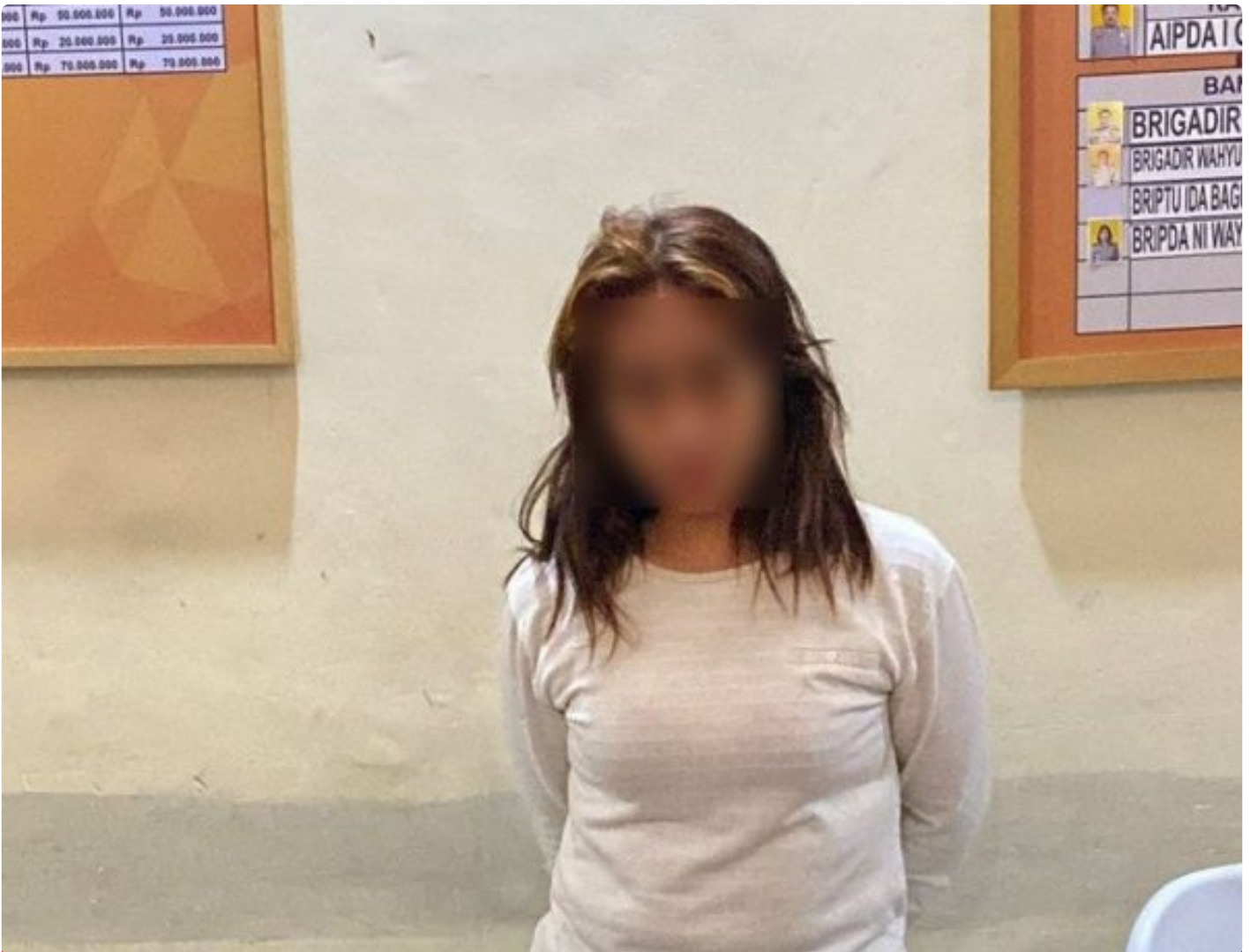
Tersangka pengedar sabu yang diamankan Sat Resnarkoba Polresta Mataram. (12/05/2024)

Mataram NTB - Seorang Ibu Rumah Tangga (IRT) asal Cakranegara terpaksa diamankan tim Opsnal Sat Narkoba Polresta Mataram di kediamannya di salah satu Kos-kosan di wilayah Cakranegara, Kota Mataram, Minggu, (12/05/2024) sekitar pukul 01 : 30 wita.